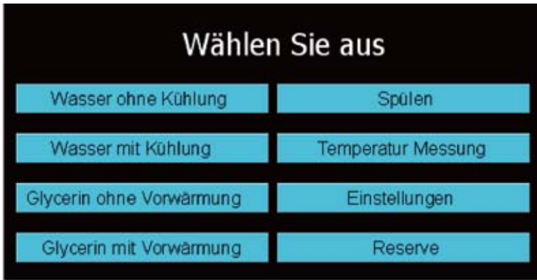
Das Display mit dem Auswahl-Menü zu Beginn der Messung.