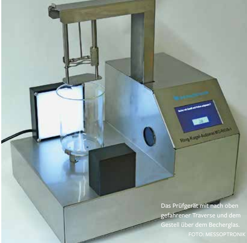
Das Prüfgerät mit nach oben gefahrener Traverse und dem Gestell über dem Becherglas.